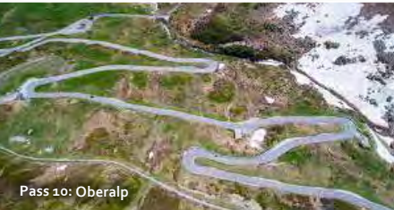
Pass 10: Oberalp