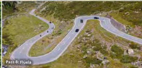
Pass 8: Flüela