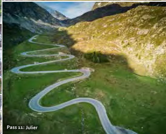
Pass 11: Julier