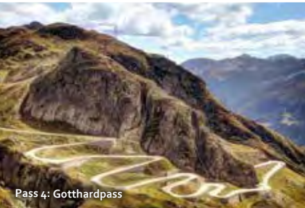
Pass 4: Gotthardpass