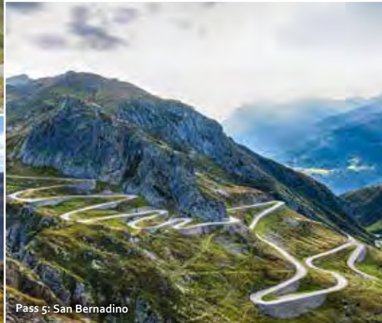
Pass 5: San Bernadino