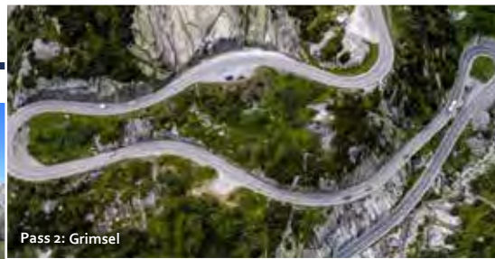
Pass 2: Grimsel