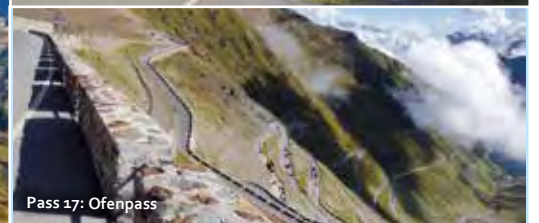
Pass 17: Ofenpass