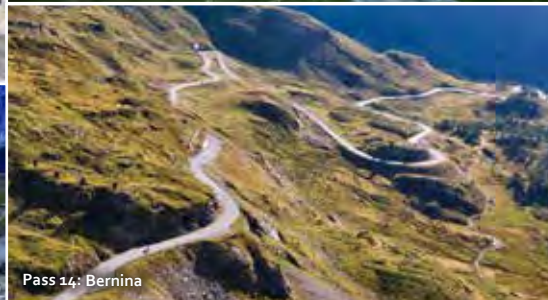
Pass 14: Bernina