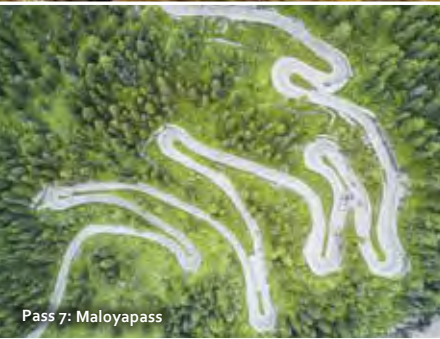
Pass 7: Maloyapass