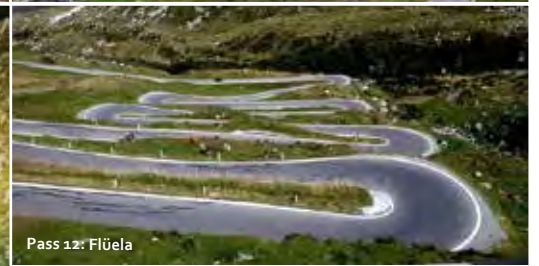
Pass 12: Flüela