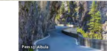
Pass 13: Albula