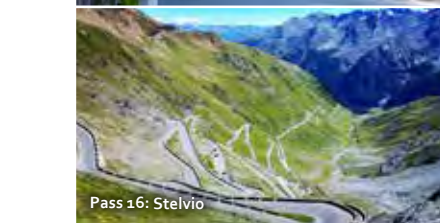
Pass 16: Stelvio