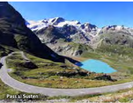
Pass 1: Susten