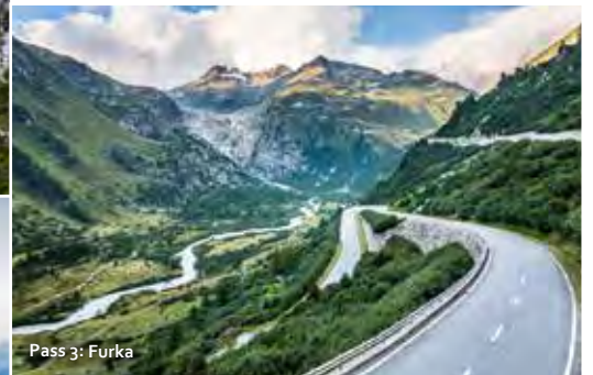
Pass 3: Furka