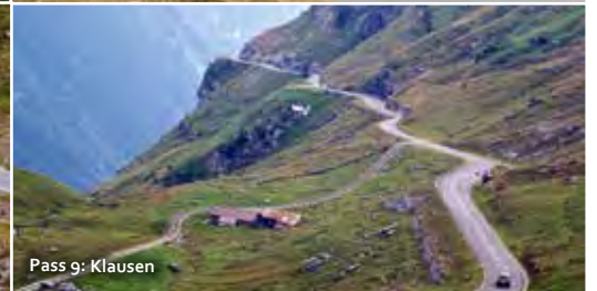
Pass 9: Klausen