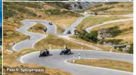
Pass 6: Splügenpass