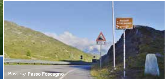
Pass 15: Passo Foscagno